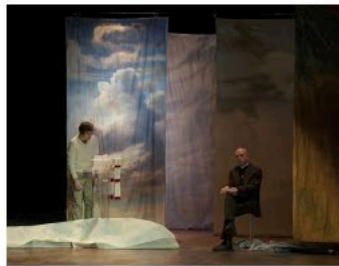
« Le ciel est pour tous »