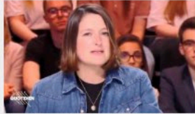
Une journaliste de "Quotidien" dit avoir été convoquée par la DGSJ pour "compromission du secret de la défense nationale"