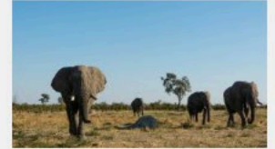
Le Botswana, principal territoire des éléphants d'Afrique, lève l'interdiction de les chasser