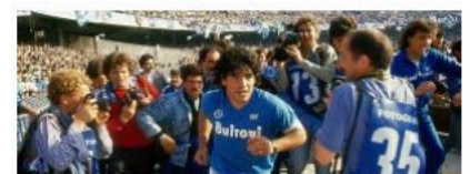
Cannes 2019 : "Diego Maradona", une tragédie grecque à Naples