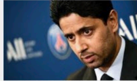
Le président du PSG, Nasser Al-Khelaïfi, mis en examen pour "corruption active"