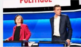
A trois jours des européennes, le Rassemblement national et La République en marche restent au coude-à-coude, selon notre sondage Ipsos/Sopra Steria