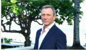
James Bond : nouvelle blessure sur le tournage pour Daniel Craig