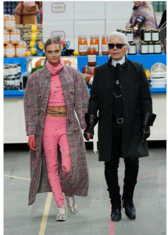
Défilé Chanel – Automne Hiver 2014 / 2015 – Cara Delevingne et Karl Lagerfeld

Lors du défilé de lundi nous avons pu contempler de sublimes créations, mais également une superbe mise en scène.